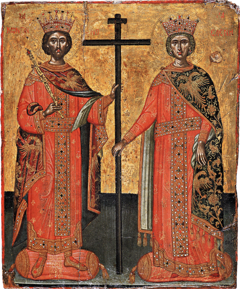
Ἅγιοι Κωνσταντῖνος καὶ Ἑλένη, οἱ θεόστυποι μεγάλοι βασιλεῖς καὶ ἰσαπόστολοι Ἀπολυτίκιον. Ἦχος πλ. δ'.

Τ οῦ Σταυροῦ σου τὸν τύπον, ἐν οὐρανῷ θεασάμενος, καὶ ὡς ὁ Παῦλος τὴν κλησιν, οὐκ ἐξ ἀνθρώπων δεξάμενος, ὁ ἐν βασιλεῦσιν Ἀπόστολός σου Κύριε, βασιλεύουσαν πόλιν τῇ χειρὶ σου παρέθετο ἦν περίσφωξε διὰ παντὸς ἐν εἰρήνῃ, πρεσβείαις τῆς Θεοτόκου, μόνε Φιλάνθρωπε.